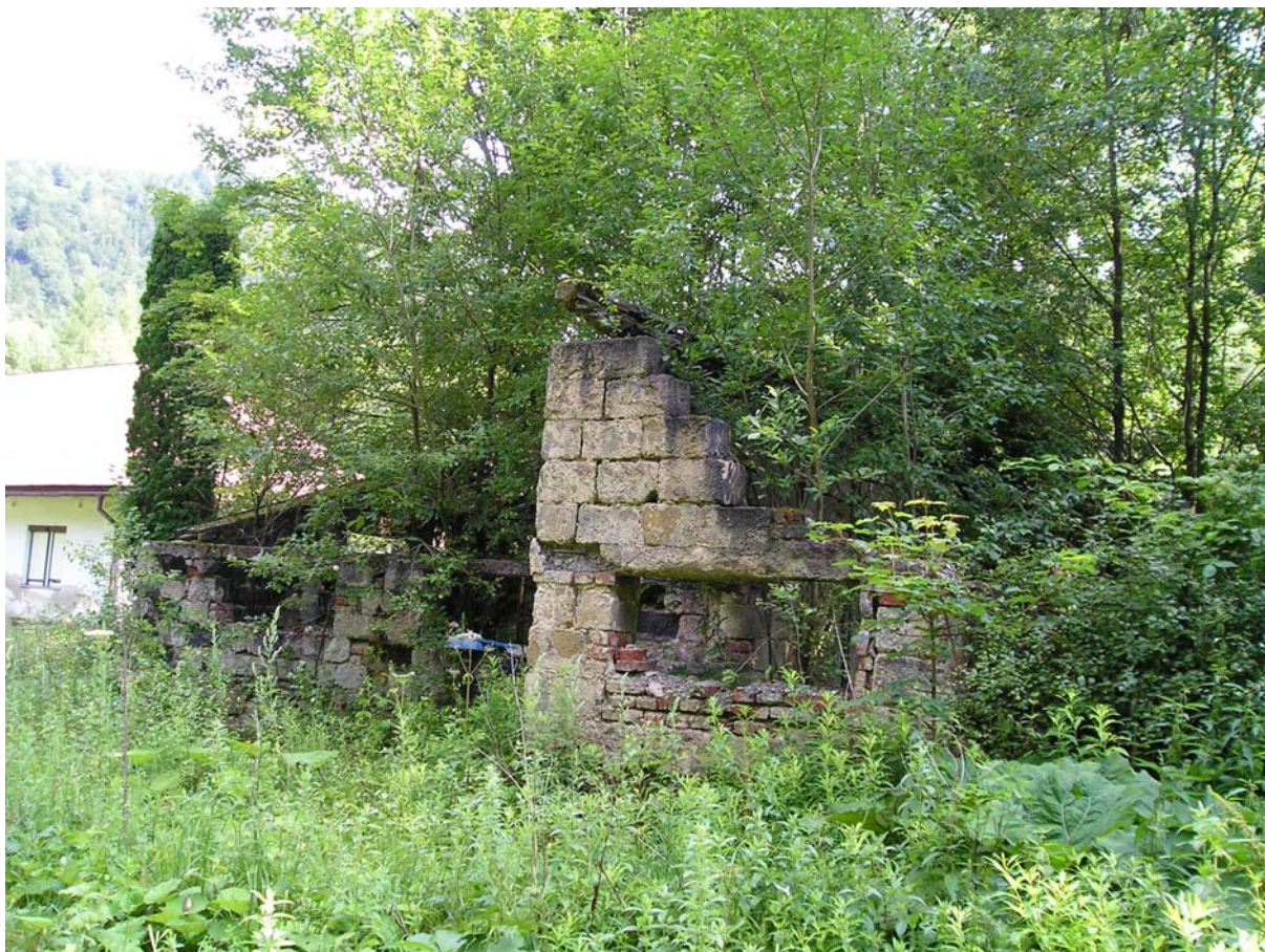
Vchod do niečoho a niečo v Korytnici, s čím budú mať určite aj archeológovia starosti. Možno je to časť tribúny, lebo za zrúcaninami sú zvyšky ihriska.