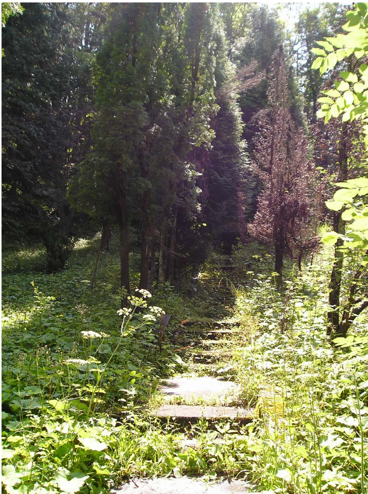
Slovensko-romantická aleja. Vo dne bola prázdna, ale možno podvečer a v noci sa po nej stále prechádzajú milenci. Alebo, že by si ju už dávno označili lesné zvieratká pre nočné milovánky?