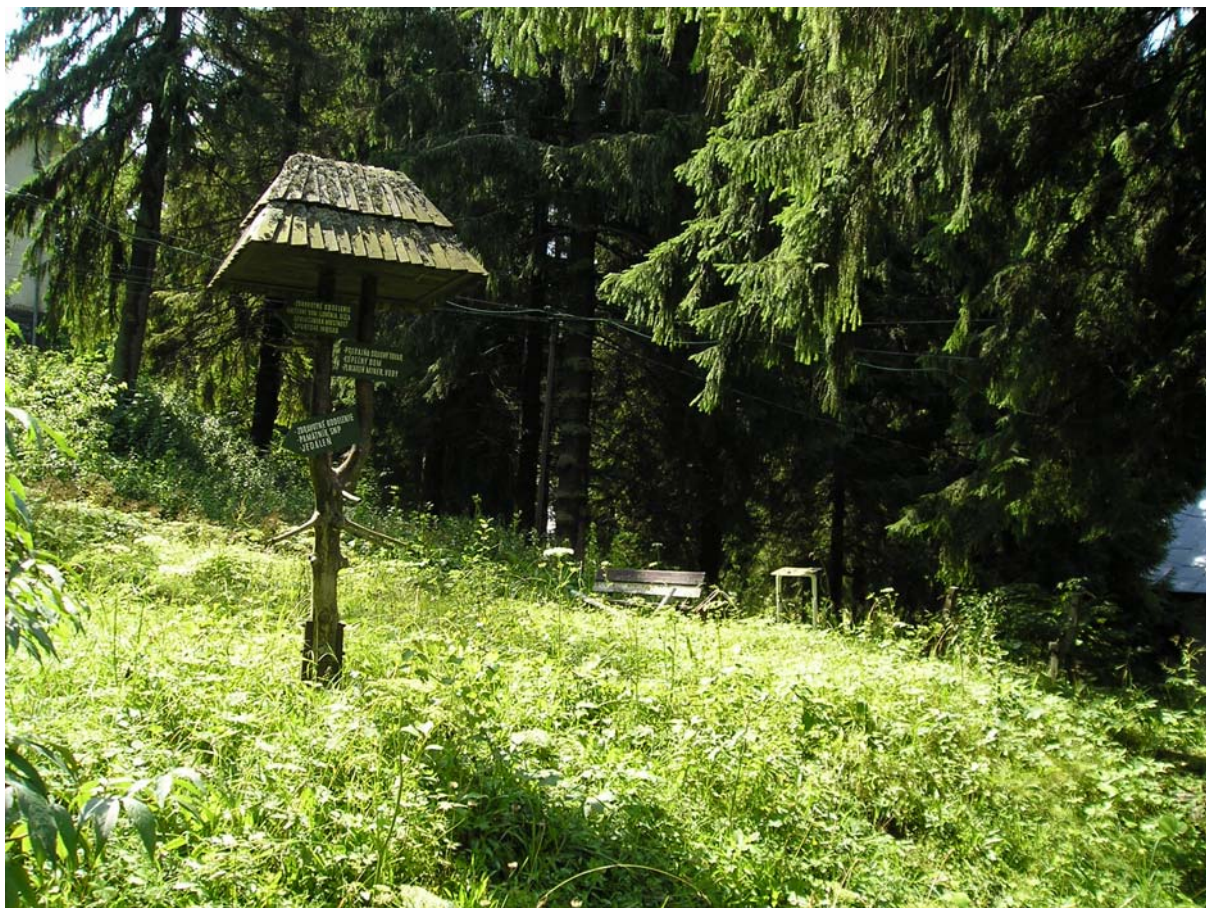
Tabuľka „komunistickej totality“ a romantická lavička „slobody a demokracie“. Len, ako sa k nej dostať.