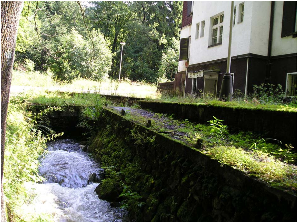
Romantiku riečky zrejme kazilo zábradlie, ktoré malo tiež nejakú cenu.