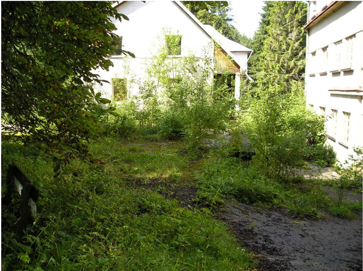
Zátišie na priedomí a naľavo s lavičkou. Žeby tanečný parket?