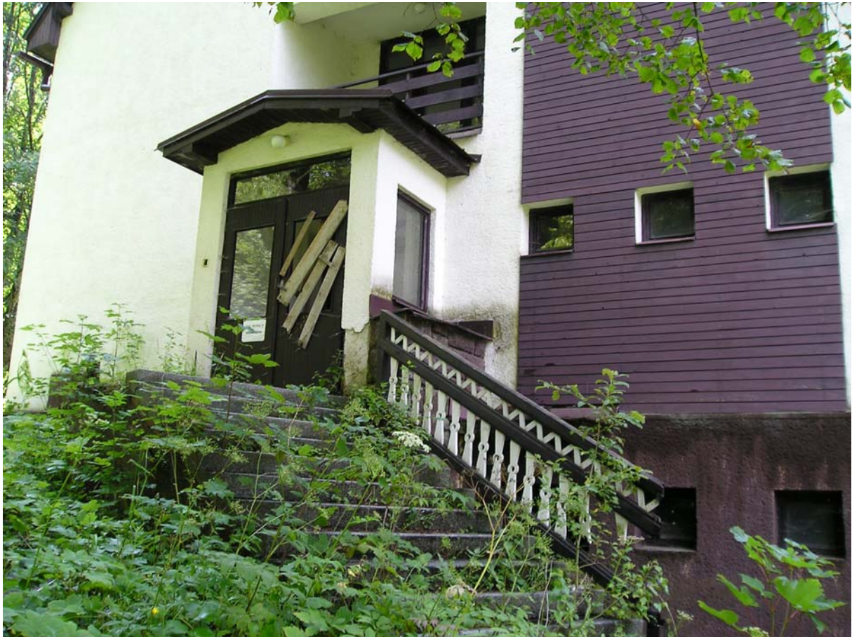
Budova kúpeľov. Mramorové schody „komunistickej totality(?)“ a drevená výzdoba „slobody a demokracie“.