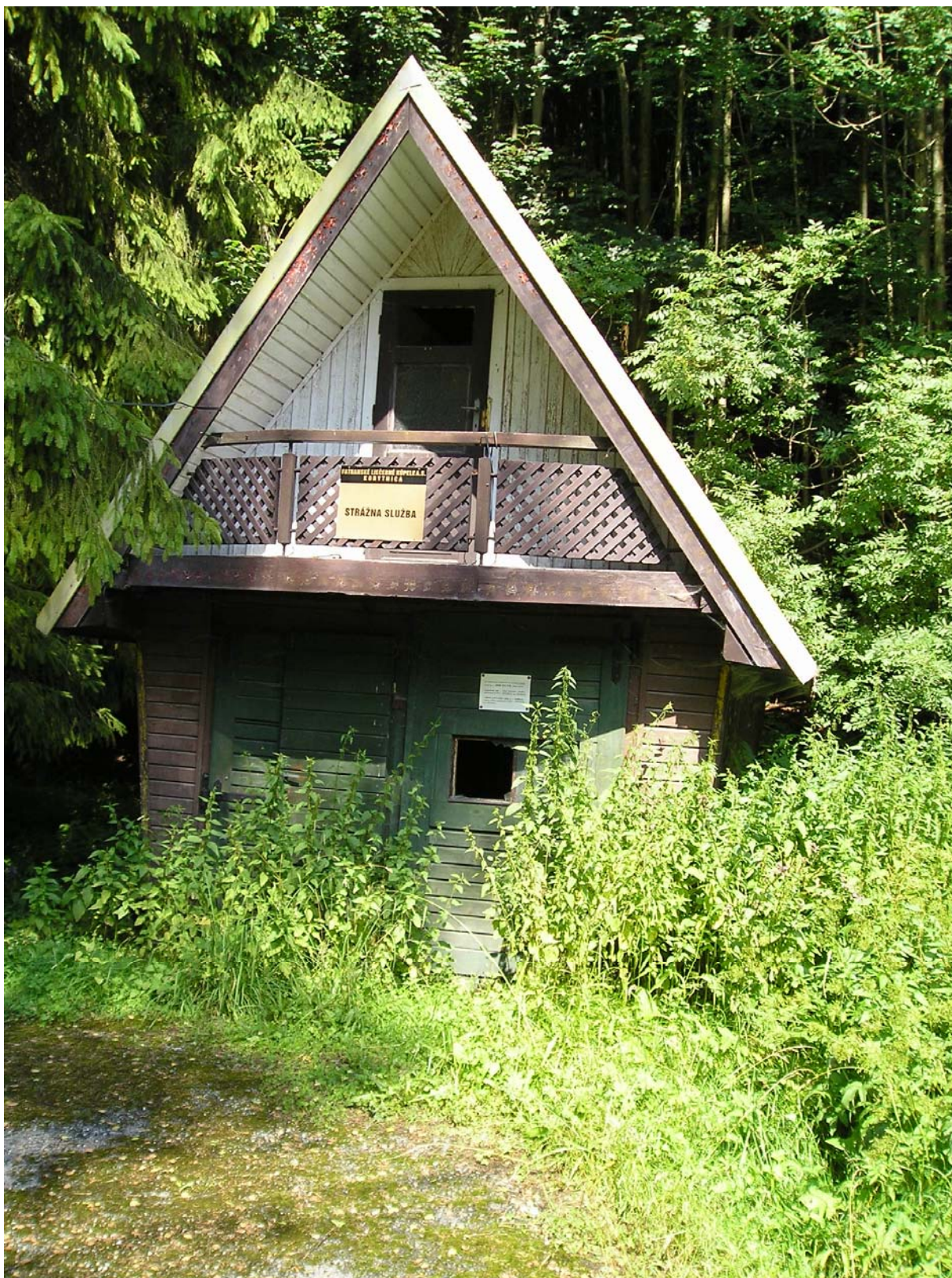
U vchodu je vrátnica (asi), na poschodí so strážnou službou. Tabuľka je stále neporušená.