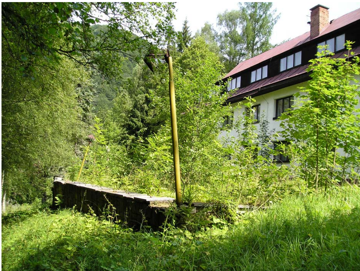
Terasa s naklonenými lampami – detail pre skutočných romantikov.